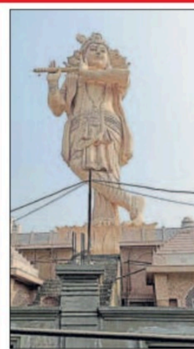
गौर यमुना सिटी में लगी भगवान श्री कृष्ण की मूर्ति। • हिन्दुस्तान

योग एवं प्राकृतिक चिकित्सा केंद्र खुलेंगे : यमुना प्राधिकरण क्षेत्र की गौड़ यमुना सिटी में भगवान श्रीकृष्ण की मूर्ति की स्थापना की गई है। यह मूर्ति 106 फीट ऊंची है। अगर यमुना एक्सप्रेसवे से गुजरेंगे तो आपको यह मूर्ति दिख जाएगी। इसके साथ ही राया में हेरिटेज सिटी प्रस्तावित है। इसकी डीपीआर बन रही है। यहां पर कथा वाचनालय, वेलनेस सेंटर, योग केंद्र, प्राकृतिक चिकित्सा केंद्र खोले जाएंगे। यह क्षेत्र वृंदावन से जोड़ा जाएगा। यह आध्यात्मिक लोगों को अपनी ओर खींचेगा।