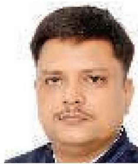
मनीष खेमका • जागरण